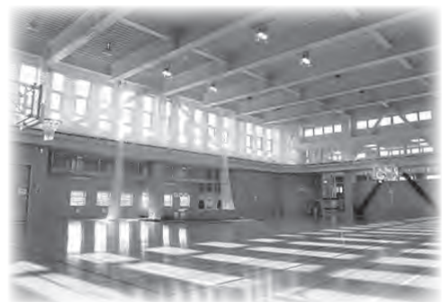
こども元気センター 屋内運動場

児童に健全な遊びを与え、健康増進や情操を豊かにすること、また、子育てをする家庭及び地域社会との交流を推進し、子どもの健やかな成長を支援するため、小名浜児童センター・こども元気センター・内郷子育て支援センターを設置しています。