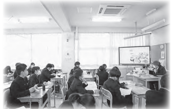
エアコン設置後の教室の様子