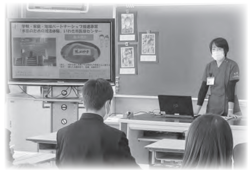
久之浜中学校「職業講話」

学校・家庭・地域と公民館が連携し、子どもたちの「生きる力」を育む様々な体験・交流活動を行うとともに、地域ぐるみで子どもを守り育てる協力体制の整備に向けた施策を展開します。