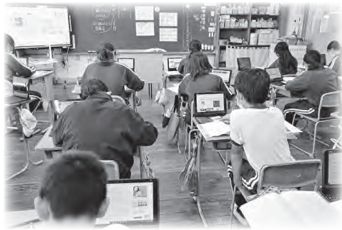
情報機器を活用した授業風景