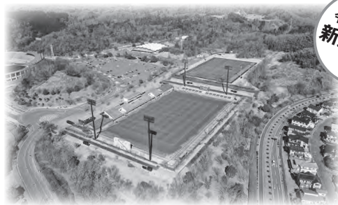
ハワイアンズスタジアムいわき