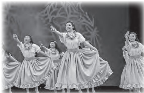
フラガールズ甲子園