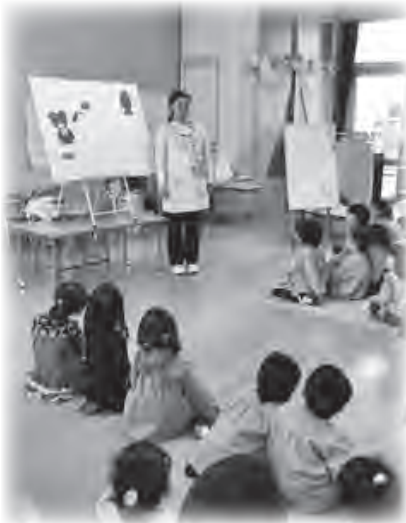
市立幼稚園での授業風景