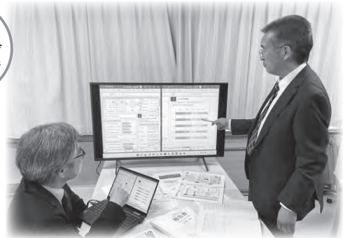
助言を行う学力向上アドバイザー