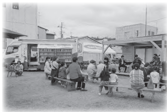
移動図書館車の地域イベントへの参加

地域や各分野の現状・課題を広い視野で認識できる機会を提供するため、「いわきヒューマンカレッジ (市民大学)」を設置し、市民の学習ニーズを捉えた専門的な学部講座を開設します。