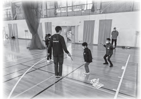
市民スポーツ教室「なわとび教室」

市民スポーツ教室の開催やニュースポーツ・レクリエーションスポーツの普及活動を通じて、市民が気軽にスポーツを行う場を提供し、生涯にわたりスポーツを楽しむことが出来る環境づくりに努めるとともに、総合型地域スポーツクラブの普及啓発や設立支援を行います。