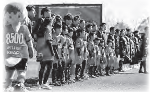
J2リーグ いわきFCホームゲーム

いわきFCが掲げるスポーツの力を最大限に活用したまちづくりに共感した市内の様々な団体が参画している「スポーツによる人・まちづくり推進協議会」やいわきFCと連携し、市民のスポーツへの興味や関心を高めるとともに、ホームタウンとしての機運醸成を図りながら、スポーツを通じたまちづくりの推進を図ります。