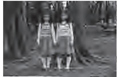
牛腸茂雄『SELF AND OTHERS』 1977年発行