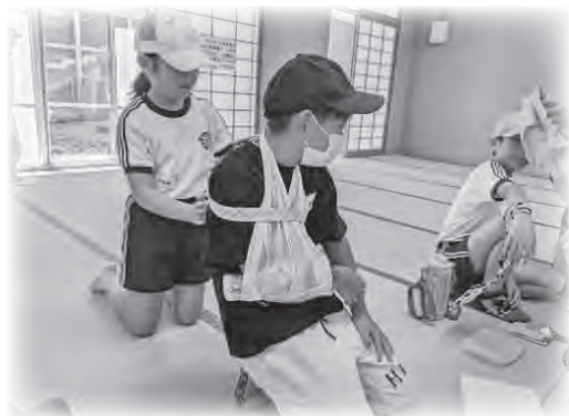
小名浜第二小学校「いざという時のために」