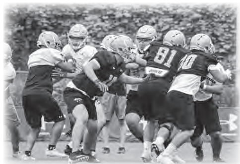
東京大学アメリカンフットボール部合宿