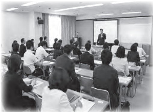
教職員研修の様子