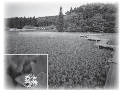
市指定天然記念物「差塩湿原」