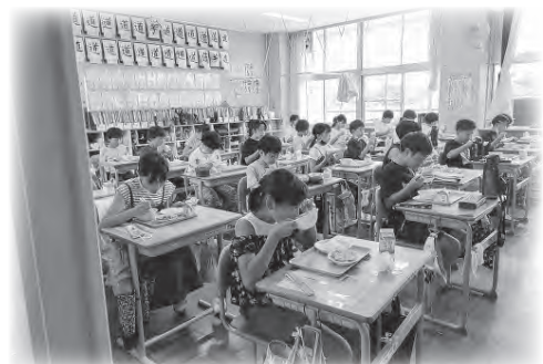
小学校の給食風景