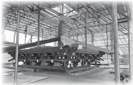
高蔵寺三重塔修復事業の様子