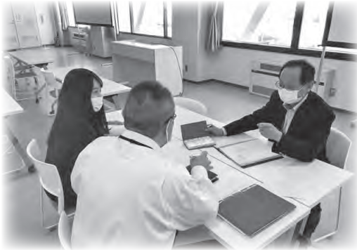
特別支援教育に関する協議の様子