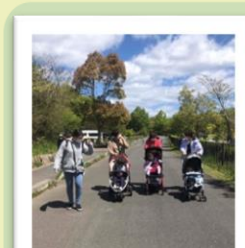
～ 活 動 の 様 子 ～